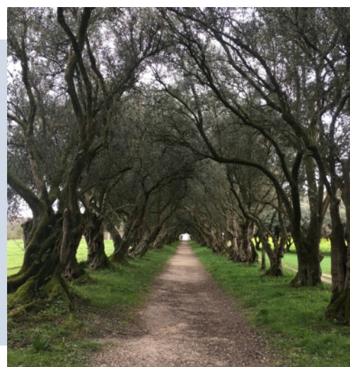
Jardín del Pazo de Santa Cruz de Ribadulla. A Coruña.