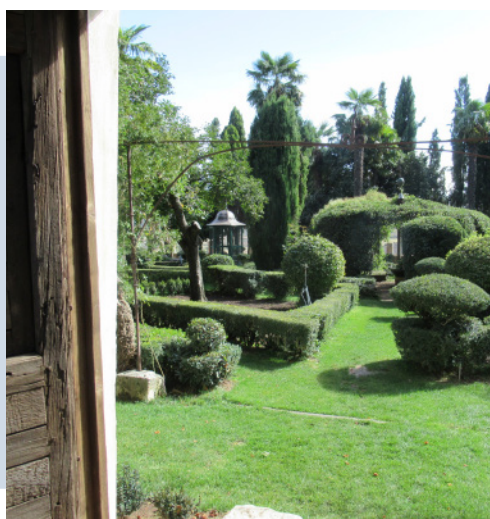
Jardín de la Real Fábrica de Paños en Brihuega, Guadalajara.