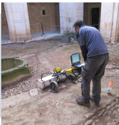
Trabajos de georadar en el Claustro Menor del Monasterio de San Pedro de Arlanza en Hortigüela. Burgos.

La obtención del certificado está condicionada por la asistencia presencial a un mínimo de 80 % del seminario.