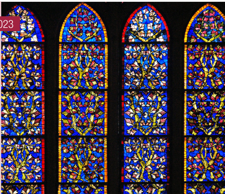
Catedral de León.