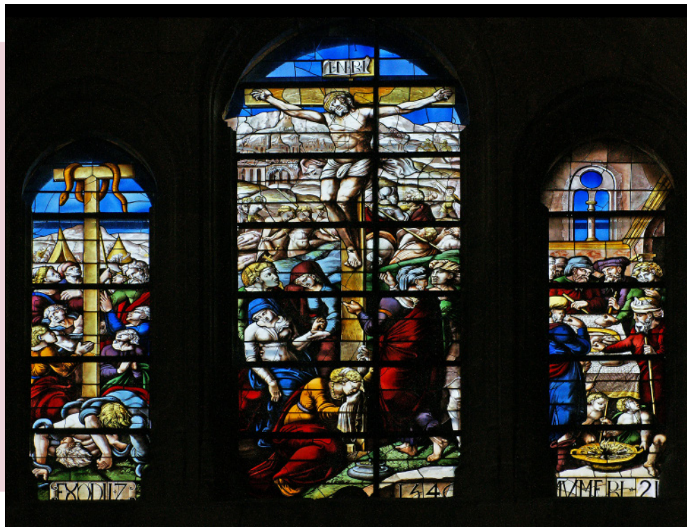
Dos detalles de la Catedral de León.